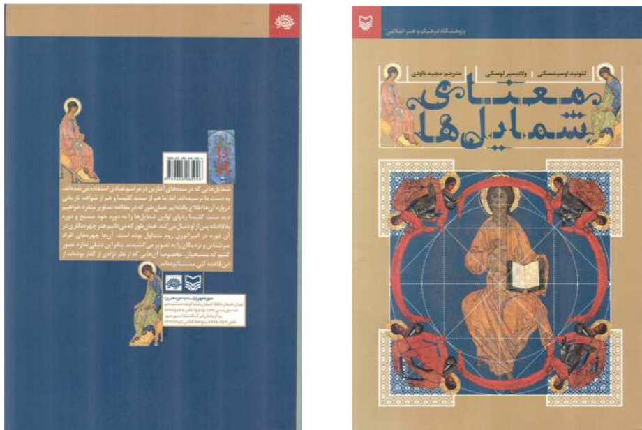
شکل ۲. طرح جلد ترجمه