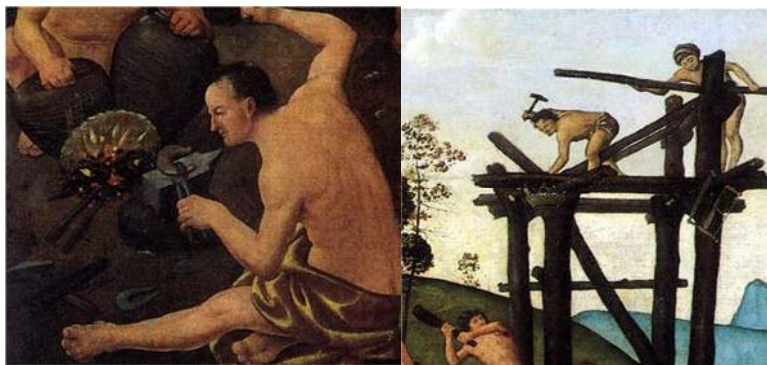
۱- بخش‌هایی از نقاشی «ولکان و ائولو» (Vulcano ed Eolo) اثر پیرو دی‌کوزیمو، (پانوفسکی ۲۰۱۸: تصویر شماره ۱۸)

پانوفسکی از طرح این بحث، این است که نشان دهد در نقاشی‌های دی‌کوزیمو مضامین و نقش‌مایه‌هایی از اسطوره‌های کلاسیک وجود دارد که تفسیر آن‌ها تنها به یاری متن‌های ادبی و فلسفی همان دوره مقذور است و چنانچه متون ادبی و فلسفی در تفسیر این اثر به‌کارگرفته نشوند، معنایی که تصویر انتقال داده است، به فهم در نمی‌آید. به همین دلیل او در ادامه بحث متونی از ویتروویوس (Marcus Vitruvius Pollio) ۹ و بوکاجو (Giovanni Boccaccio) ۱۰ را مورد بررسی قرار می‌دهد (Panofsky 2018: 39-49). نویسنده در ادامه سعی دارد دو مضمون را در کنار هم قرار داده و به تحلیل پردازد؛ نخست توصیفات ویتروویوس درباره دوره‌های تمدن‌پذیری بشر و ساخت خانه‌ها و استفاده از ابزارها و دوم، توصیف اسطوره ولکان در آثار بوکاجو با تأکید بر نقش ولکان در آموزش دادن به انسان‌ها و تکامل استعداد‌های بشر. شیوه استفاده پانوفسکی از منابع تاریخی و اسطوره‌ای و استفاده از این منابع برای تحلیل، آنجا روشن می‌شود که در نمونه‌ای از نقاشی‌های دوره دوم حیات هنری دی‌کوزیمو (تصویر شماره ۱ و ۲) کارگرانی تنومند ترسیم شده‌اند که با ابزارهایی مانند میخ، چکش و اره، مشغول ساختن چارچوب خانه‌ای هستند. پانوفسکی این نقاشی را دقیقاً همان توصیف ویتروویوس درباره تحول تکنولوژیک در تمدن بشری می‌داند. «در ابتدا انسان‌ها تیرهای چوبی ساختند، سپس شاخه‌های درخت‌ها را به‌هم‌بافته و بر روی آن‌ها قراردادند و در نهایت آموختند که چگونه با گل دیوارهایی بسازند» (ibid: 44).