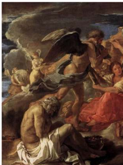
۴- نقاشی «رقص زندگی بشر» (Il Ballo Della Vita Humana) اثر نیکلای پوسن، ۱۶۳۵م. (پانوفسکی ۲۰۱۸: تصویر شماره ۶۷)

اسطوره‌ای و ساتورن قرون وسطایی است و این وجه از شخصیت ایزد زمان را با آثار اوید (Ovid) ۱۲ و همچنین در کتاب تبارشناسی خدایان (Theogonia) ۱۳ اثر هسیود مستندسازی می‌کند.