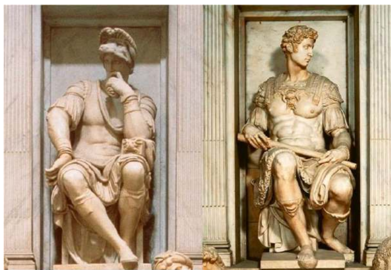
۷- مجسمه «لورتسو مدیچی در مقبره مدیچی»، اثر میکل آنژ، ۱۵۲۰-۱۵۳۴ م. (همان: تصاویر شماره ۱۵۴ و ۱۵۵)

میکل آنژ نیز در این تصویر دو بال فرشته ترسیم کرده است. یکی بیان‌کننده عدالت ورزی است که از زندگی عملی حاصل می‌شود و دیگری بیان‌گر دین‌داری است که از زندگی وقف نظر منتج می‌گردد (ibid:192). جالب آنجاست که میکل آنژ در مجسمه‌ای با نام متفکر نیز این آموزه زندگی وقف نظر را به‌کار برده است (ibid: 193). پانوفسکی همچنین با اشاره به اثری دیگر از میکل آنژ، مقبره مدیچی، اذعان می‌کند که میکل آنژ این آموزه دوگانه زندگی وقف عمل و نظر را در بازنمایی چهره مدیچی (تصویر ۷) و ژست او که شبیه به مجسمه متفکر است، نشان‌دهنده تضادی می‌داند که به میانجی این آموزه کهن برای بازنمایی چهره مدیچی مورداستفاده قرار داده است.