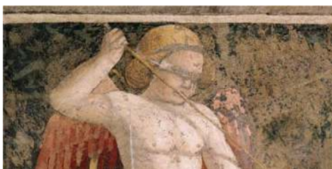
۵- بخشی از نقاشی «کویپد با چشمان بسته»، پیرو دلا فرانچسکا، ۱۴۶۶ م. (پانوفسکی ۲۰۱۸: تصویر شماره ۹۲)

کلاسیک عشق در پیوند با اسطوره کویپد شکل گرفت و در آثار هنری دوره قرون وسطی کویپد با نواری بسته شده بر روی چشمان ترسیم شده است. نویسندگان در این رابطه شواهد تصویری بسیاری از کتاب آثار هنری دوره قرون وسطی آورده است. سپس با عطف توجه به هنر دوره رنسانس که موضوع اصلی بحث این کتاب را تشکیل می‌دهد، به تشریح ابعاد وسیع این مسئله می‌پردازد که متون فلسفی دوره رنسانس به احیای مفهوم «عشق» بر اساس منابع کلاسیک پرداختند اما هنرمندان این دوره، با فراروی از توصیفات متنی، برای بازنمایی کویپد او را با چشمانی بسته ترسیم کردند تا مضمون عشق کور و عشق متعالی را به صورتی متناقض انتقال دهند (ibid:121). به عنوان نمونه، پیرو دلا فرانچسکو (Piero della Francesca) ۱۷ نقاش دوره رنسانس، در نقاشی دیواری خود در بازلیکای سن فرانچسکو، کویپد را به هیئت کودکی که تیروکمان در دست دارد ترسیم کرده است، در حالی که چشمان او با چشم‌بند بسته شده‌اند.