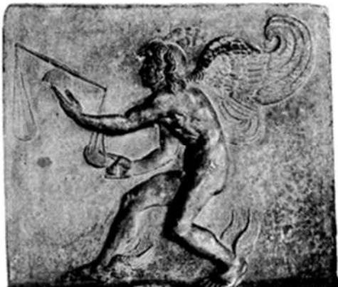
۲- تصویر «کایروس»، نقش برجسته یونانی، ۱۶۰-ق م (پانوفسکی ۲۰۱۸: تصویر شماره ۳۵)