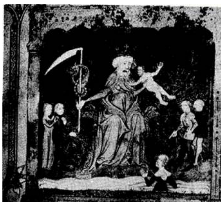
۳- تصویر «ساتورن»، رم، ۱۴۰۰ م. (همان: تصویر شماره ۴۵).

بر این اساس، چهره‌ زمان که در دوره کلاسیک با ترکیب دو ویژگی فانی بودن (کایروس) و جاودانگی خلاق (آیون) بیان شده بود، در هنر رنسانس وجهی نابودگر یافته و با تصویر سیاره زحل درآمیخته است. پانوفسکی در ادامه بحث با بررسی نقاشی‌های پوسن (Nicolas Poussin) ۱۱ بیان می‌کند که او وجه ویرانگری زمان را که انتقال‌دهنده مضامین سیاره زحل است، با دو وجه دیگر زمان که در اسطوره‌ها بدان‌ها اشاره شده است، یعنی «خلاقیت» و «فانی بودن» درهم‌آمیخته و این تضاد را در نقاشی خود به وحدت رسانده است (ibid: 92). وی نتیجه می‌گیرد که تصویر زمان در آثار پوسن، ترکیبی از آیون