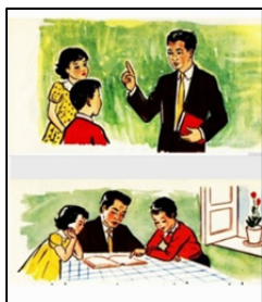
کتاب اول دبستان (۱۳۳۹)