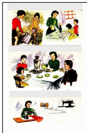
کتاب اول دبستان (۱۳۳۹)