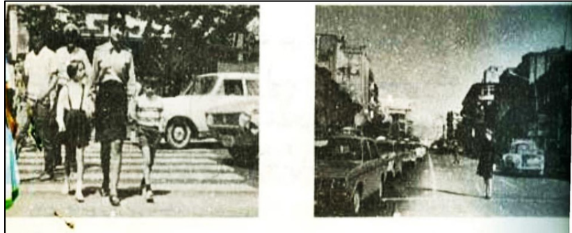
کتاب فارسی پنجم دبستان (۱۳۵۵)