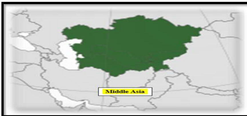
نقشه ۲: آسیای میانه ↑