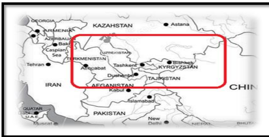
نقشه ۱: آسیای مرکزی ↑

با چنین اوصافی ترجمه این کتاب هرچند به خودی خود اقدام مفیدی است اما این که کارکرد این کتاب را یک "منبع اصلی" برای واحد درسی تاریخ اسلام در آسیای میانه در مقاطع کارشناسی و کارشناسی ارشد دانشجویان رشته تاریخ قلمداد کنیم در بهترین فرض نشانه غفلت از اقتضائات یک متن درسی در نظام آموزش عالی است. اگر "سخن ناشر" حداقل عنوان می‌کرد که این کتاب را به عنوان یک "متن جنبی و فرعی" برای دانشجویان این واحد درسی ترجمه و منتشر ساخته است قابل پذیرش بود. اما به هر حال این غفلتی است که ناشر (سمت) مرتکب شده است. این غفلت هنگامی که با دخل و تصرف در ترجمه عنوان کتاب همراه می‌شود و اصطلاح "آسیای درونی" که هدف و انگیزه نویسنده را بهتر نمایندگی می‌کند با اصطلاح "آسیای میانه" که هدف ناشر را تأمین می‌کند جایگزین می‌شود، می‌تواند شائبه اغفال را نیز به دنبال داشته باشد.