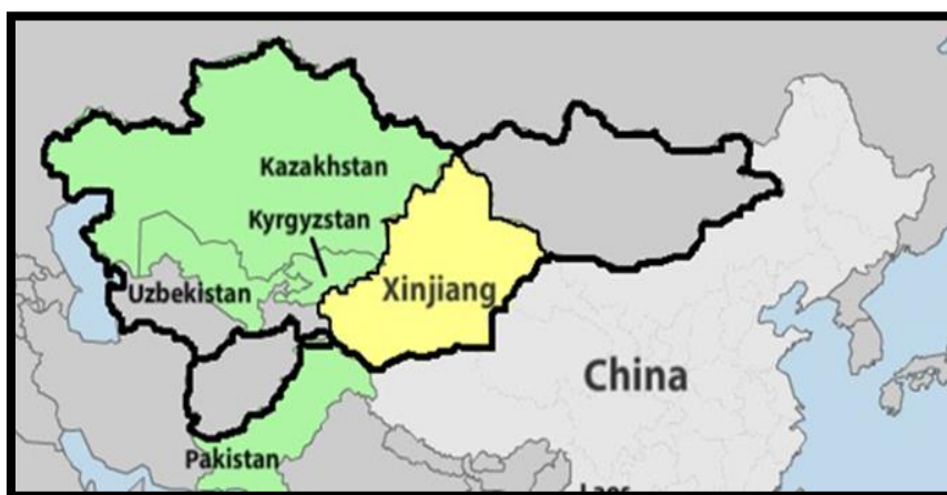
نقشه ۳: آسیای درونی ↑